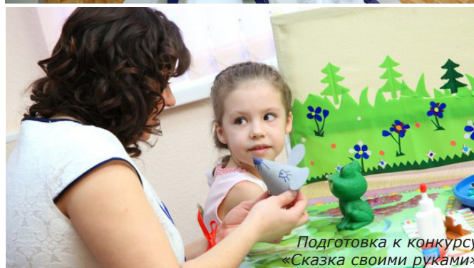
Подготовка к конкурсу «Сказка своими руками»