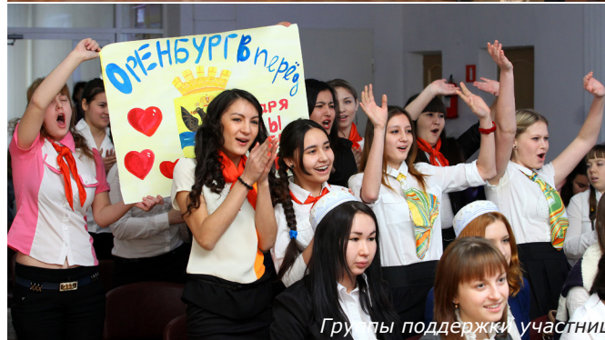
Группы поддержки участниц