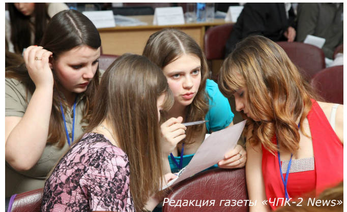
Редакция газеты «ЧПК-2 News»