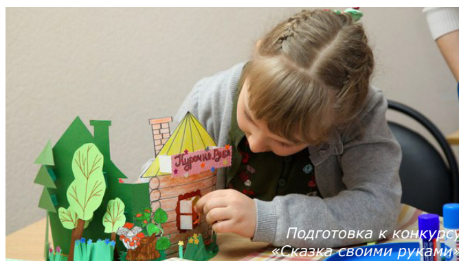
Конкурс «Сказка своими руками»