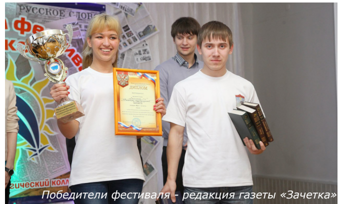
Победители фестиваля - редакция газеты «Зачетка»

конкурсантов и их умения владеть словом; а так же фоторепортаж на тему «Я и...», который показал, на что способна фантазия молодых журналистов. Все ребята проявили творчество, оригинально подошли к каждому заданию. Каждая команда хотела отвоювать заветный кубок, и в воздухе витал дух соперничества. Но самое интересное началось, когда жюри ушли подводить итоги, от конкуренции ни осталось и следа. Такое было чувство, как будто в зале собрались давно знакомые приятели. Чтобы как-то заполнить паузу подведения итогов, участники по очереди начали выходить на сцену и